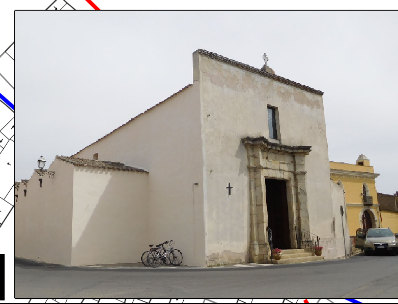
Chiesa Parrocchiale Beata Vergine della Neve