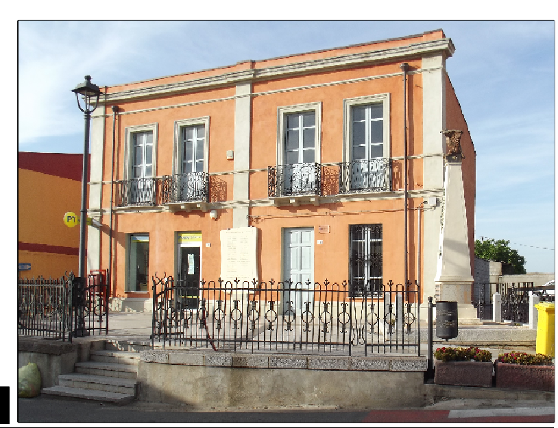
Unità Edilizia "A" - Isolato 3