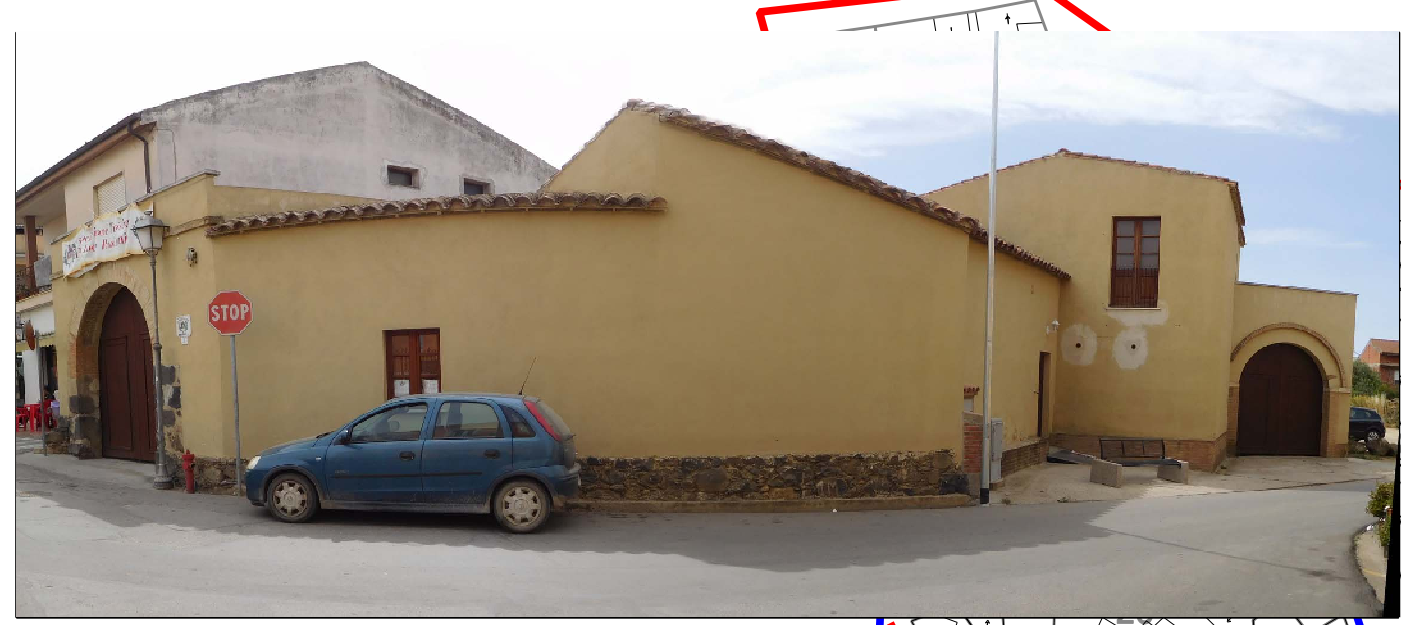
Unità Edilizia "E" - Isolato 8