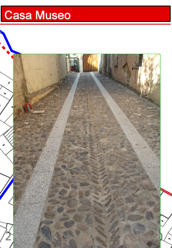
Pavimentazione Strada in Centro Storico