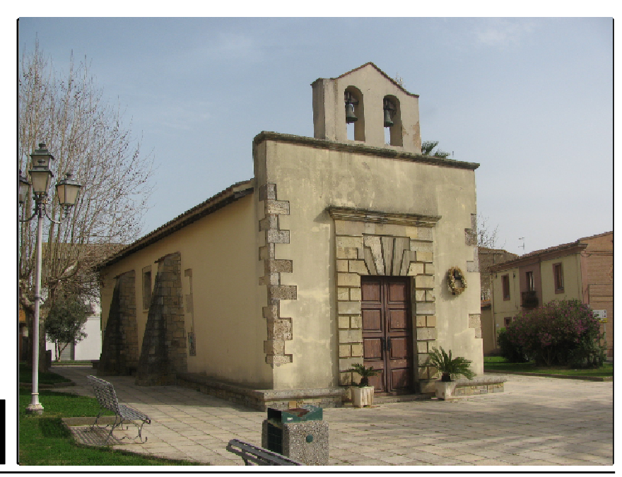
Chiesa di San Giovanni Battista