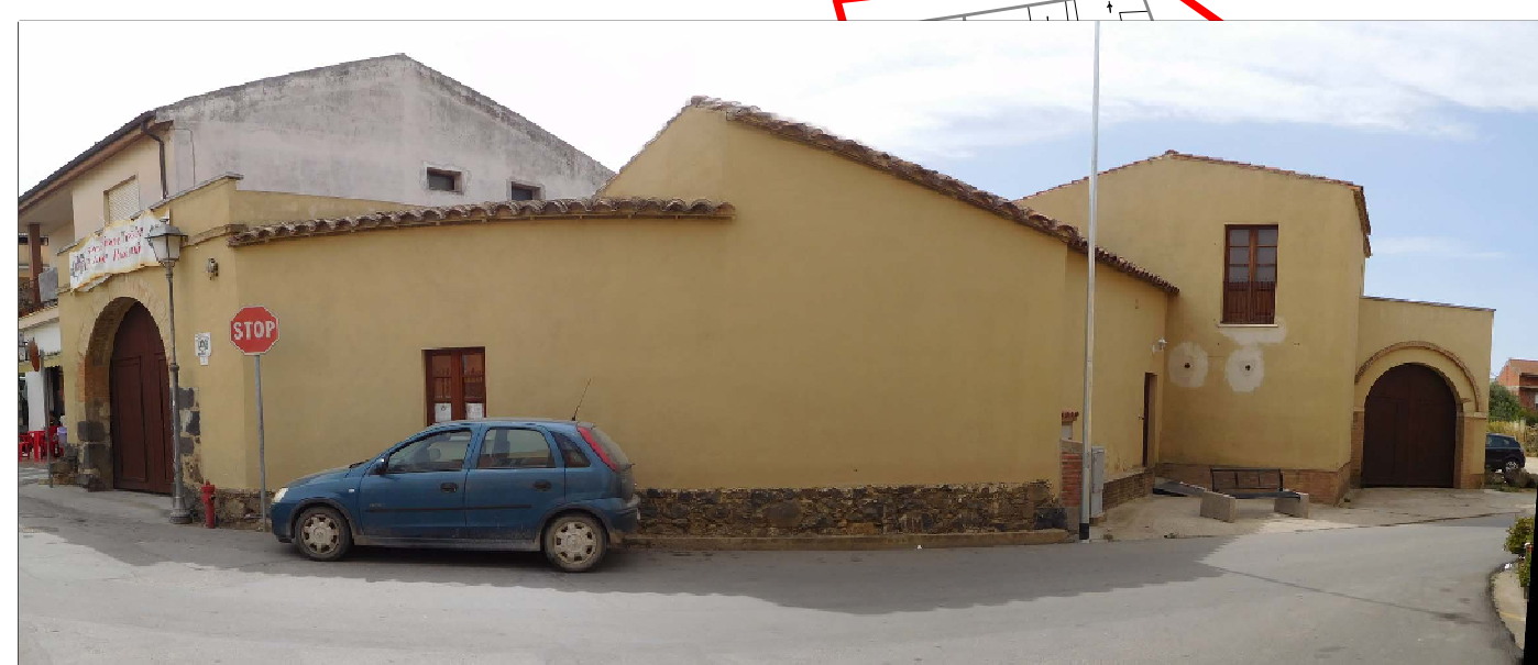
Unità Edilizia "E" - Isolato 8