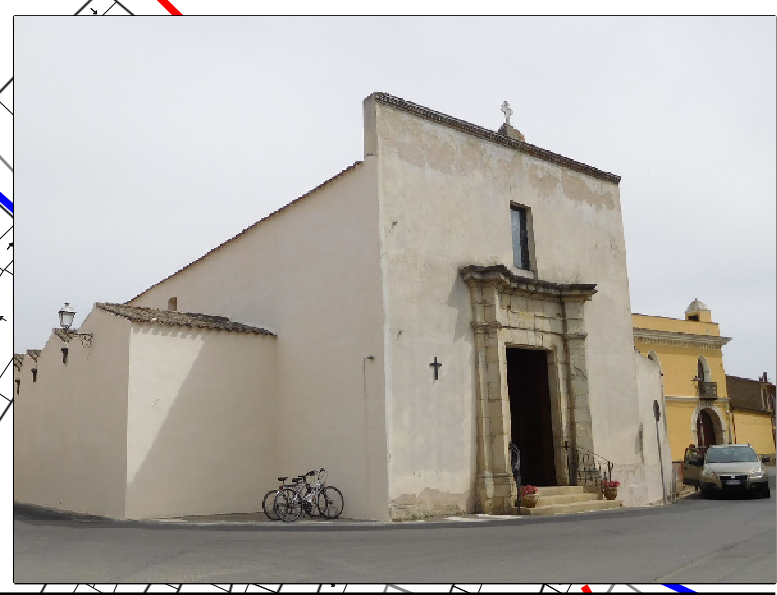
Chiesa Parrocchiale Beata Vergine della Neve