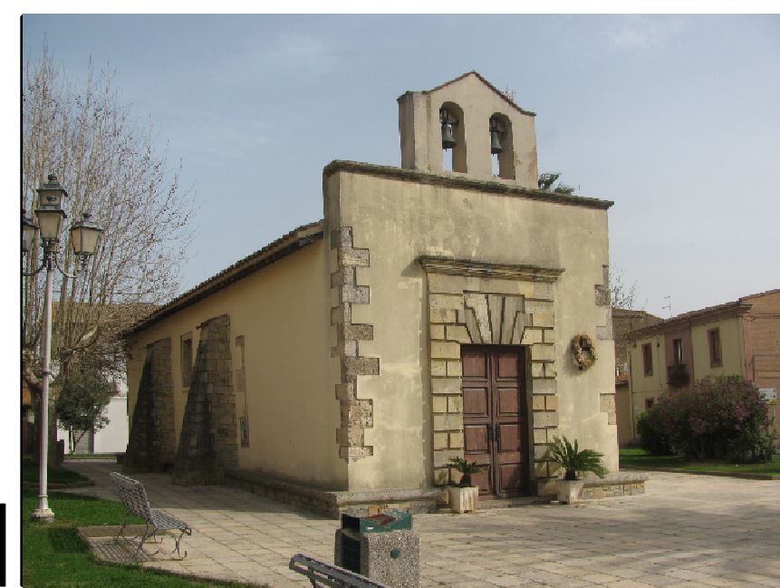
Chiesa di San Giovanni Battista