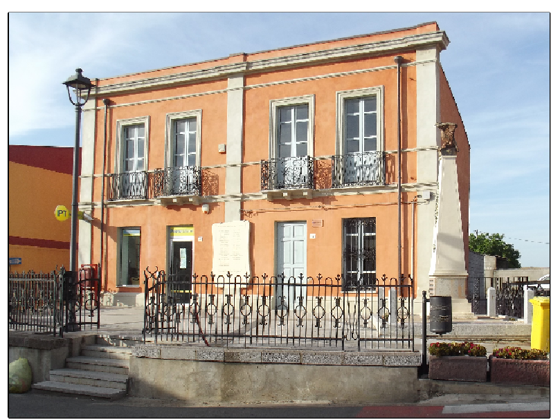
Unità Edilizia "A" - Isolato 3