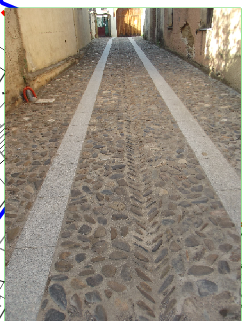
Pavimentazione Strada in Centro Storico